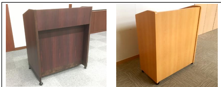
◆ 演台(2階 / 7階・8階)